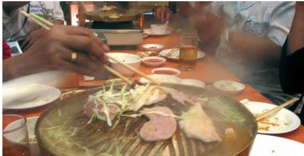
Es ist wichtig, die Menschen an ihren angestammten Plätzen zu treffen