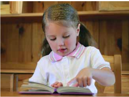
Ein kleines Mädchen blättert in einer Kinderbibel

logen haben diesen Prozess als „Inspiration“ bezeichnet.